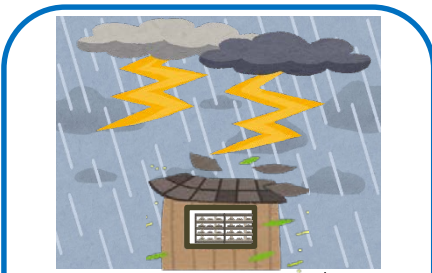
落雷等により電気供給が停止し、 菌床施設の管理ができなくなった場合