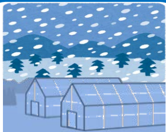
雪害等により、設備が壊れ栽培や出荷ができなくなった場合